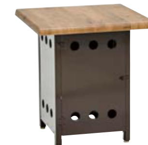
ボンベ収納サイドテーブル NBST-6×6/ブラウン 本体価格¥67,000 W600×D600×H650mm 主材/ウエルザリッツ・アルミ 重量/12.0kg