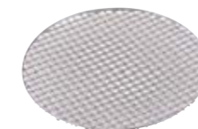
焼アミ 本体価格¥5,500 φ300mm ステンレス