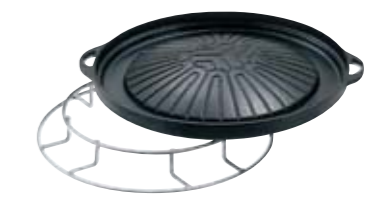
ジンギスカン鍋 Barbecue Plate 本体価格¥11,000 φ335mm 主材/鑄鉄製 ジンギスカンプレート受 本体価格¥9,500 主材/鉄製(軟鋼鉄)