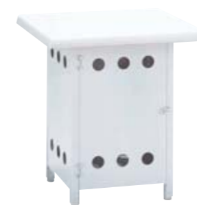
ボンベ収納サイドテーブル NBST-6×6 本体価格¥67,000 本体価格¥75,000(キャスター付き) W600×D600×H650mm 主材/ウエルザリッツ・アルミ 重量/12.0kg