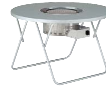
BTY-1L2 本体価格 ¥153,000(グリルNBG-LP/Z込) (テーブル ¥55,000+NBG-LP/Z ¥98,000) φ1,200×H640mm 主材/アルミ 重量/10.0kg 折りたたみ可