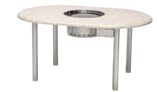
NWT-C146×94B2アルマイト4/ マーブル+NBG-LP/Z NEW 本体価格 ¥248,000(グリルNBG-LP/Z込) テーブル ¥150,000+NBG-LP/Z ¥98,000 W1,460×D940×H650mm 天板/ウエルザリッツ 脚/アルミφ60(アルマイト仕上) 組立式