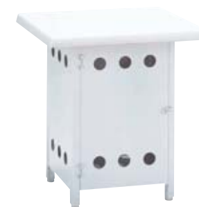
ボンベ収納サイドテーブル NBST-6x6 本体価格 ¥67,000 本体価格 ¥75,000(キャスター付き) W600×D600×H650mm 主材/ウエルザリッツ・アルミ 重量/12.0kg