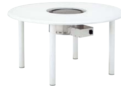
NWT-1200B2/ホワイト+NBG-LP/Z 本体価格 ¥165,000(グリルNBG-LP/Z込) (テーブル ¥67,000+NBG-LP/Z ¥98,000) φ1,200×H650mm 天板/ウエルザリッツ 脚/アルミφ60白色(粉体塗装) 組立式