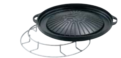
ジンギスカン鍋 Barbecue Plate 本体価格 ¥11,000 φ335mm 主材/鋳鉄製 ジンギスカンプレート受 本体価格 ¥9,500 主材/鉄製(軟鋼鉄)