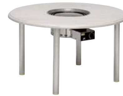
NWT-C1200B2アルマイト4/ パリサイドホワイト+NBG-LP/Z NEW 本体価格 ¥165,000(グリルNBG-LP/Z込) (テーブル ¥67,000+NBG-LP/Z ¥98,000) φ1,200×H650mm 天板/ウエルザリッツ 脚/アルミφ60(アルマイト仕上) 組立式