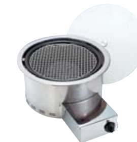
ニチエスバーベキューグリル Nicheus Barbecue Grill NBG-LP/Z 本体価格 ¥98,000(プロパンガス) W570×D415×H199mm 重量/約10.0kg 組立式 本体/ステンレス 水受/スチールホーロー フタ/アルミ 焼アミ/ステンレス 立消え安全装置付 別売のジンギスカン鍋やお手持ちの鍋を使用される場合は、 別売のジンギスカンプレート受(¥9,500)が必要です。 ニチエスバーベキューグリル Nicheus Barbecue Grill NBG-NG/Z 本体価格 ¥120,000(都市ガス) ●価格はすべて税抜き価格です。