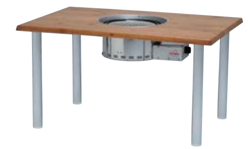
NWT-C12×8B2アルマイト4/コロラド+NBG-LP/Z 本体価格 ¥160,000(グリルNBG-LP/Z込) (テーブル ¥62,000+NBG-LP/Z ¥98,000) W1,200×D800×H650mm 天板/ウエルザリッツ 脚/アルミφ60(アルマイト仕上) 組立式 ●高温の場所でのご使用はお避けください。