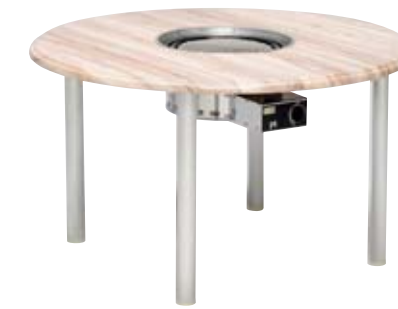
NWT-C1200B2アルマイト4/ カリフォルニア+NBG-LP/Z NEW 本体価格 ¥165,000(グリルNBG-LP/Z込) (テーブル ¥67,000+NBG-LP/Z ¥98,000) φ1,200×H650mm 天板/ウエルザリッツ 脚/アルミφ60(アルマイト仕上) 組立式